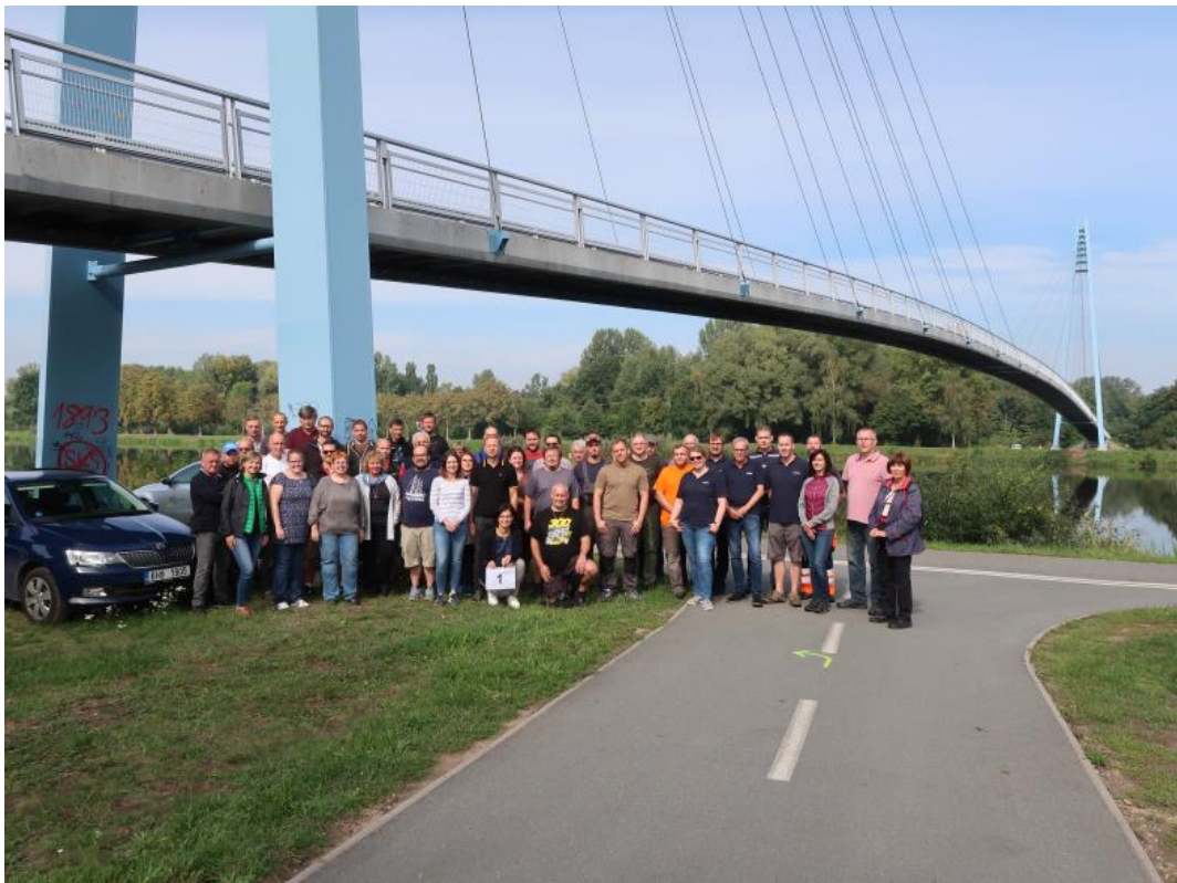
Teilnehmer der gemeinsamen Probenahme